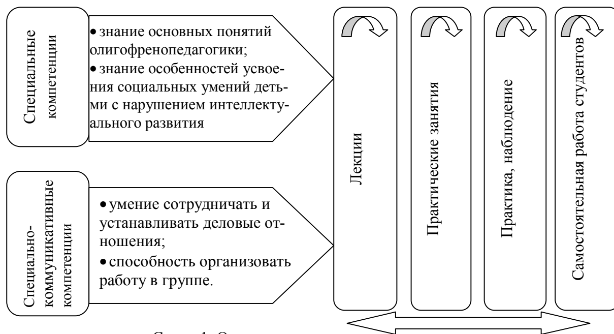
Схема 1. Основное содержание проекта

Изучение дисциплины «Основы олигофренопедагогики» проходит в форме лекций, практических занятий, практики наблюдения и самостоятельной работы студентов во внеучебное время. (Схема 1)